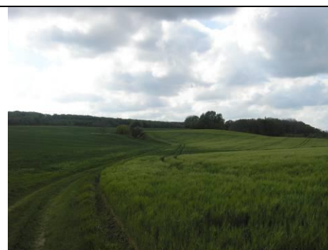
Figur 9: Sti syd for Tåstrup Sø på vej mod udsigt ved gravhøj.