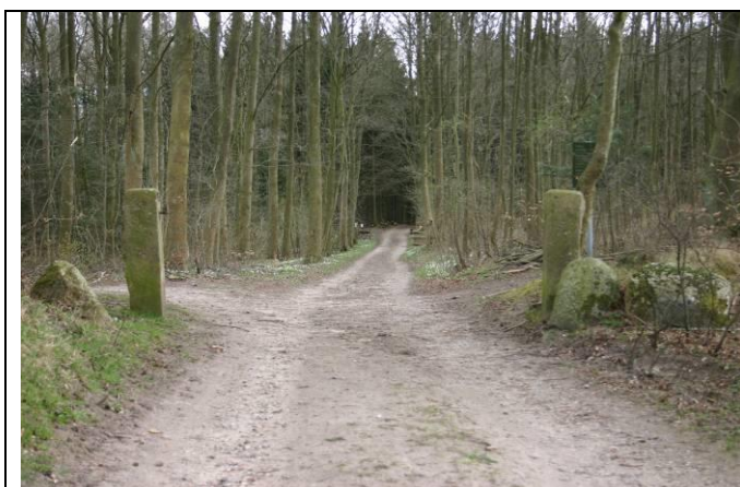
Figur 2: Ledsten ved den nordlige indgang til Lillering skov ved Bøgebakken.