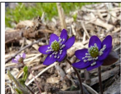
Figur 4: Blå Anemone. Findes bl.a. under Hassel ved kildevæld i Stjær Søskov.

Skrænterne og områderne oven for skrænterne er skovbevokset. I alt er der 69,7 ha fredskov, overvejende med Bøg, hvoraf 48,8 ha er udpeget som habitatskovtyper. I Lillering Skov findes desuden en del smalle slugter med Ask, mindre partier med lysåben Stilk-egeskov samt bevoksninger med nåletræer. Der er stor sandsynlighed for, at skovene rummer partier, som aldrig har været dyrket. Af skovtræer skal nævnes Avnbøgen, som er et vigtigt element i både Lillering og Stjær skovene. Af øvrige planter i skovene kan nævnes Gul-, Blå- og Hvid Anemone, Guldnelde, Hvid Hestehov, Tandrod, Skovbyg og den meget sjældne Forskelligblomstret Viol. Blandt de skovlevende fugle i området tælles Natugle, Skovhornugle, Huldue, Ravn og Stor Flagspætte samt almindeligt forekommende pattedyr som Hare, Rådyr, Ræv og Rødmus.