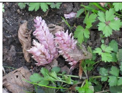
Figur 6: Skælrød. Findes i randzonen mellem Lillering Skov og Tåstrup Mose. Snylter på Hassel og Poppel.

Der er overvejende naturlige hydrologiske forhold i skoven, ca. 11 % grøftes eller drænes fortsat. Skovdriften er overvejende ekstensiv, men er ikke sikret gennem aftaler om vedvarende