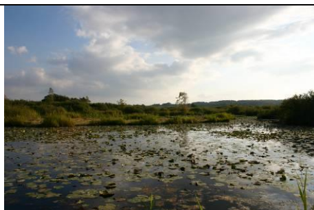
Figur 5: Vandflade i Tåstrup Mose. Her findes bl.a. vandplanten Krebseklo.