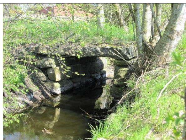
Figur 3: Stenkisteformet bro over Tåstrup Bæk.

Det senest tilkomne kulturhistoriske spor, er det resterende banetracé fra Hammel-Aarhus Jernbane, som fungerede i perioden 1902-1956. Banen blev anvendt til både person- og gods-transport, hvilket stationsbygningen i Harlev og lasterampen ved Lillering Skov vidner om. I dag er størstedelen af banetracéet forsvundet, men en strækning mellem Harlev og Lillering Skov er bevaret og benyttes i dag som stiadgang til skoven af lokalbefolkningen.