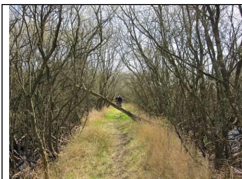
Figur 7: Sti vest for og gennem Tåstrup Mose