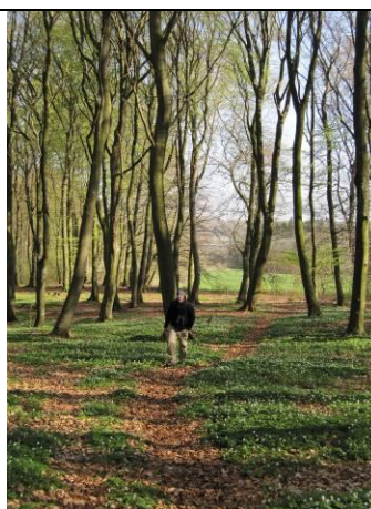
Figur 8: Sti gennem Lillering Skov.