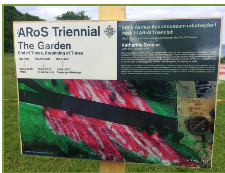
”Untitled” af Katharina Grosse vakte opsigt i Mindeparken

Det, der står tilbage som én af årets mest mindeværdige begivenheder, var i virkeligheden en rigtig ikke-sag. Som et lyn fra en klar himmel blev DN Aarhus, en tilfældig søndag i slutningen af maj, involveret i følgerikningerne af det kunstprojekt i Mindeparken, der i de efterfølgende dage og uger satte sindene i kog og fik de sociale medier til at gløde. Foranstaltet af Kunstmuseet AROS og udført af den