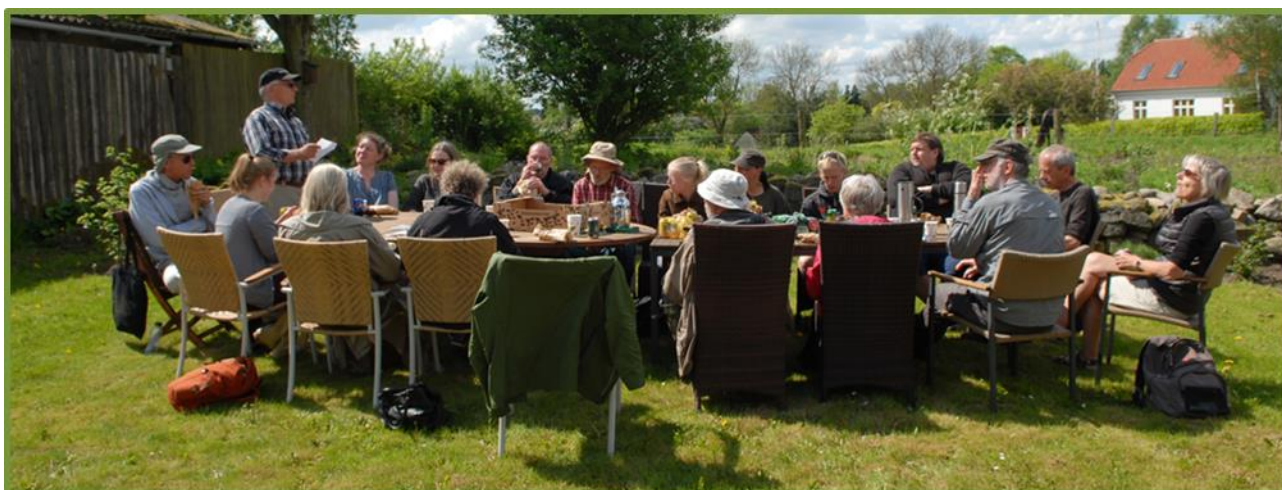
Afdelingsmøde i DN Aarhus, under åben himmel

Det er faktisk bemærkelsesværdigt, så langt man kan nå ad frivilligheden vej. Det er DN Aarhus' virke et forbilledligt eksempel på. Lokalafdelingen består alene af frivillige medlemmer, organiseret i en bestyrelse og et netværk af Aktive. Alle er ulønnede og enhver bidrager efter tid, lyst og evne. Arbejdet foregår typisk i mindre arbejdsgrupper, og fælles drøftelser og beslutninger sker på jævnlige afdelings- og bestyrelsesmøder, hvorunder der også kan være faglige oplæg e. lign. Afdelingens prioriteringer – for sådanne er der nødvendigvis – og daglige arbejder, afspejler gerne en blanding af de aktives faglige baggrund og personlige motivation, men DN Aarhus kan til enhver tid trække på de professionelle ressourcer og fagspecifikke kompetencer som findes i DN Sekretariatet i København.