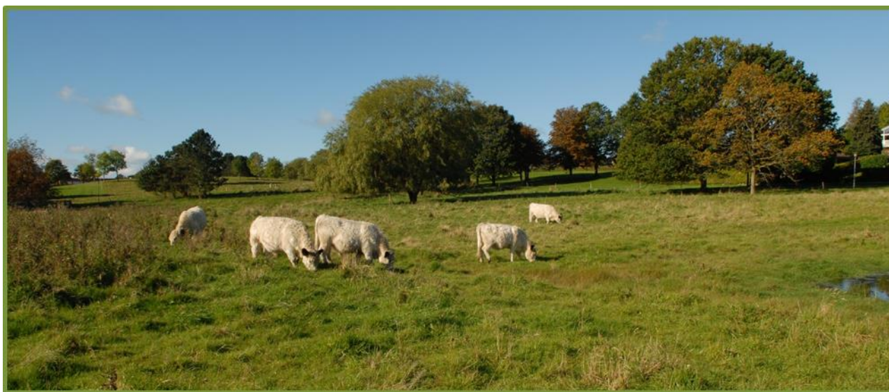
I Hovmarksparken i Lystrup græsser borgernes kreaturer på 2. sæson

På den baggrund har Aarhus Kommune forsøgt at kortlægge de vildtvoksende bestande på offentlige arealer i og omkring Aarhus. Med udgangspunkt i dette materiale, valgte DN Aarhus i sommerens løb at forsøge en mekanisk bekæmpelse på én udvalgt lokalitet, bag genbrugsstationen på Lystrupvej. Udrustet med leer mødtes en lille taskforce på ca. 10 deltagere en lørdag formiddag og brugte et par timer på at nedkæmpe de ca. 20 isolerede bestande. Efterfølgende blev det afslåede materiale indsamlet af kommunen, for derved at fjerne biomasse og forhindre frøspredning. Håbet er, at øvelsen kan gentages systematisk over en årrække, indtil forekomsterne er udpint og borte, og ideelt set ønskes aktiviteten sideløbende udvidet til at omfatte flere bestande. Kunsten vil bestå i at opretholde kontinuiteten i bekæmpelsen, med udgangspunkt i et foranderligt frivillighedsmiljø, men det ser vi som en kærkommen udfordring. Er du interesseret i at deltage i kampen, så kontakt DN Aarhus .