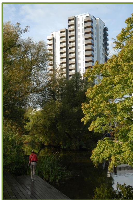
Kontrasterne skærpes i et hastigt voksende Aarhus

Heri erklærer vi os sådan set indforstået med præmissen om en storby i fortsat vækst. Der er visse forhold, som det synes omsonst at kæmpe imod, og demografisk forandring er én af dem. Desuden er det vigtigt at understrege, at DN ikke modsætter sig udvikling, fornyelse eller forandring, men blot påpeger, at det bør ske under hensyntagen til eksisterende (natur)værdier, der ikke sådan lader sig erstatte. Vi anerkender i øvrigt, at såkaldt byfortætning er et legitimt virkemiddel til at opnå mere plads på det samme areal, og dermed til at begrænse inddragelse af "jomfrueligt" land til bebyggelse. Men vi insisterer på, at fortætningen i den eksisterende by skal foregå på tidligere bebyggede arealer (f.eks. industri- og erhvervsjendomme eller udtjent boligbyggeri), og ikke på de få tilbageværende grønne områder. Samtidig er det vigtigt, at der i takt med at byen vokser etableres yderligere grønne opholdsrum og åndehuller for både mennesker og dyr.