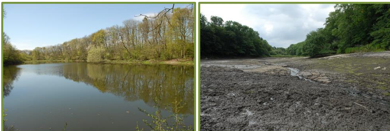
Giber ådal ved Vilhelmsborg – før og efter nedlæggelse af søen.

To år efter at opstemningen af Giber Å ved Vilhelmsborg blev alvorligt beskadiget under et voldsomt skybrud, er et opfattende naturgenopretningsprojekt netop nu i fuld gang med at blive gennemført. Forud er gået en grundig og borgerinddragende proces, med det formål at afdække mulighederne for – og opbakningen til – at nedlægge søen og genslynge Giber Å i en storslået, retableret ådal. Den politiske beslutning om at gennemføre projektet blev til DN's store tilfredshed allerede truffet sidste år, men i foråret 2017 kom selve projektforslaget så i offentlig høring. DN Aarhus afgav i den forbindelse nogle supplerende bemærkninger til vores oprindelige høringssvar.