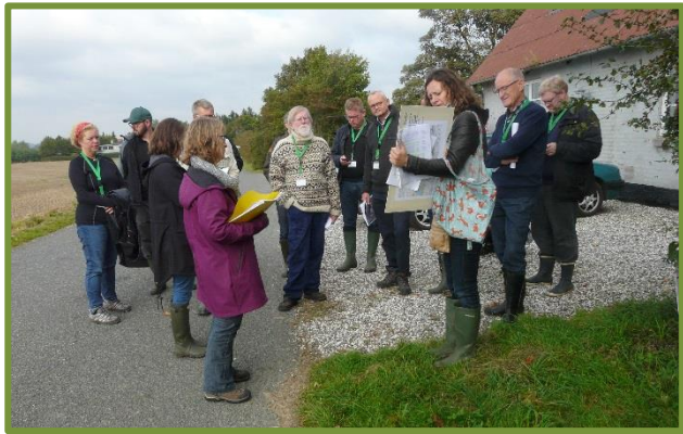
Besigtigelse i Harlev-fredningen med Miljø- og Fødevareklagenævnet og involverede parter

En lille måned efter besigtigelsen og mødet, modtog vi så den meget glædelige meddelelse, at klagenævnet har besluttet at gennemføre fredningen, som Fredningsnævnet tidligere har fastsat, dog med en række korrektioner. Bl.a. udtages et mindre areal nær Tåstrup By, og bestemmelserne for jagt ændres. Men helheden bevares, og forbuddet mod gødskning, kalkning, sprøjtning og omlægning af lysåbne arealer fastholdes. Det samme gælder ønsket om konvertering fra nål til løv. Alt i alt en kæmpesejr for naturen og for borgernes muligheder for at kunne nyde denne naturperle. Vi har grund til at ønske os alle til lykke med dette fredningsresultat.