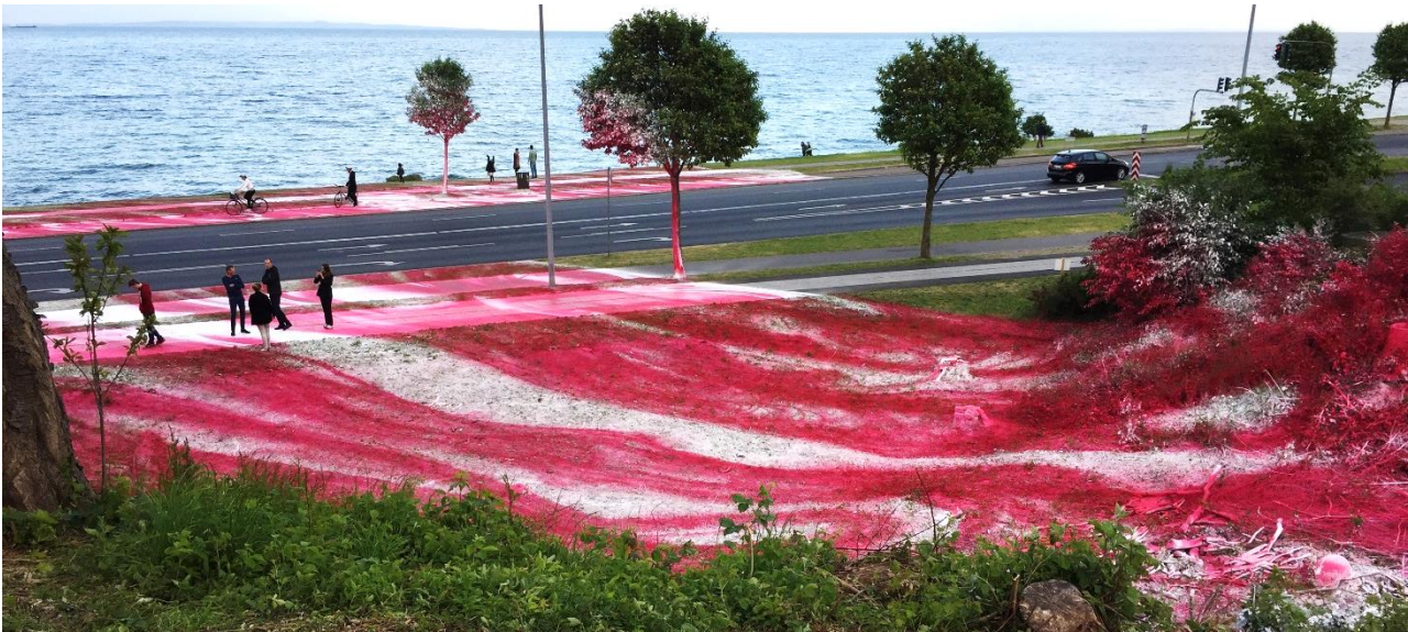
Det omstridte kunstværk "Untitled" af Katharina Grosse i Mindeparken.

I det forgangne år er der blevet malet med den brede pensel, i mere end én forstand. DN Aarhus har i talrige tilfælde skullet forholde sig til store principielle spørgsmål, og sagen om det blodrøde kunstværk i Mindeparken tog prisen som årets mest opsigtsvækkende, men samtidigt harmløse naturovergreb. Da akrylfarven og de værste misforståelser omsider var manet i jorden, gav sagen anledning til en sund og tiltrængt debat om vores natursyn; en debat, som skilte vandende i samfundet generelt, såvel som blandt DN's medlemmer.