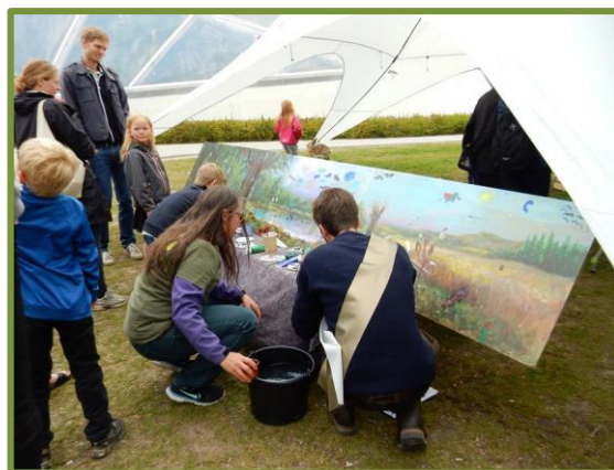
Landskabsmaleri for børn - og voksne!

På initiativ af Science Museerne afvikledes i 2016 for første gang Naturens Døgn i Væksthusene i Botanisk Have, og i år var det tid til "den svære 2'er". Sammen med Verdens Skove, Botanisk Haves Venner, Arternes Aarhus og Science Museerne inviterede DN d. 13. maj atter offentligheden til en dag med formidlingsaktiviteter og foredrag, og mange kvitterede med et besøg. Således er scenen nu sat for en fremtidig tradition, der forhåbentlig kan være med til at styrke borgernes kendskab til både DN og den biologiske mangfoldighed.