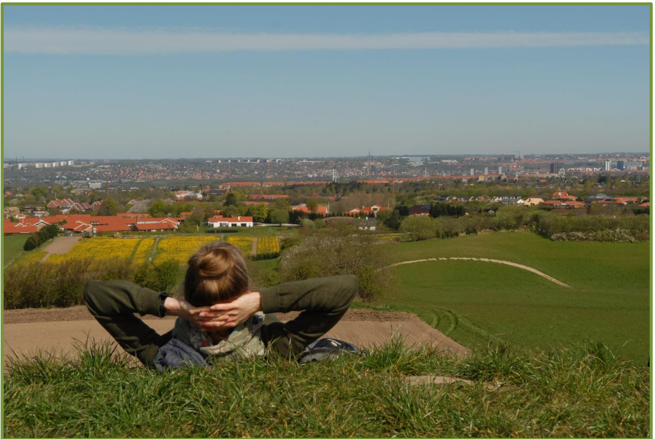
Udsigt over Aarhus fra Jelshøj i Holme Bjerge-fredningen.