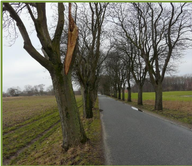
Den fredede seljerøn-allé er præget af svækkelse

Endelig er der jo lige sagen om Moesgaard Allé. Adgangen til det nye Moesgaard Museum fungerer ikke hensigtsmæssigt, så meget er alle parter enige om. Men, hvordan problemet bedst løses, er der til gengæld stor uenighed om, og netop nu præsenterer en VVM-redegørelse (Vurderinger af Virkninger for Miljøet, red.) forslag til fem løsnings-scenarier, hvoraf ét skal vælges og endeligt realiseres. Sagen har stået på længe, og det springende punkt er den gamle, fredede allé-beplantning, som Aarhus Kommune ønsker at erstatte i – bogstaveligt talt – ét hug, mens DN ønsker den bevaret og løbende retableret, i takt med at træerne ældes og forgår. Derfor anbefaler DN Aarhus at man forfølger scenarie 2 i VVM-redegørelsen , der bl.a. indebærer ensrettet indkørsel til museet ad Moesgaard Allé og udkørsel via en nyanlagt vej nord for golfbanen. DN's holdning vil fremgå af det høringsvar, som vi forventer at fremsende inden høringsfristens udløb d. 14. december 2017.