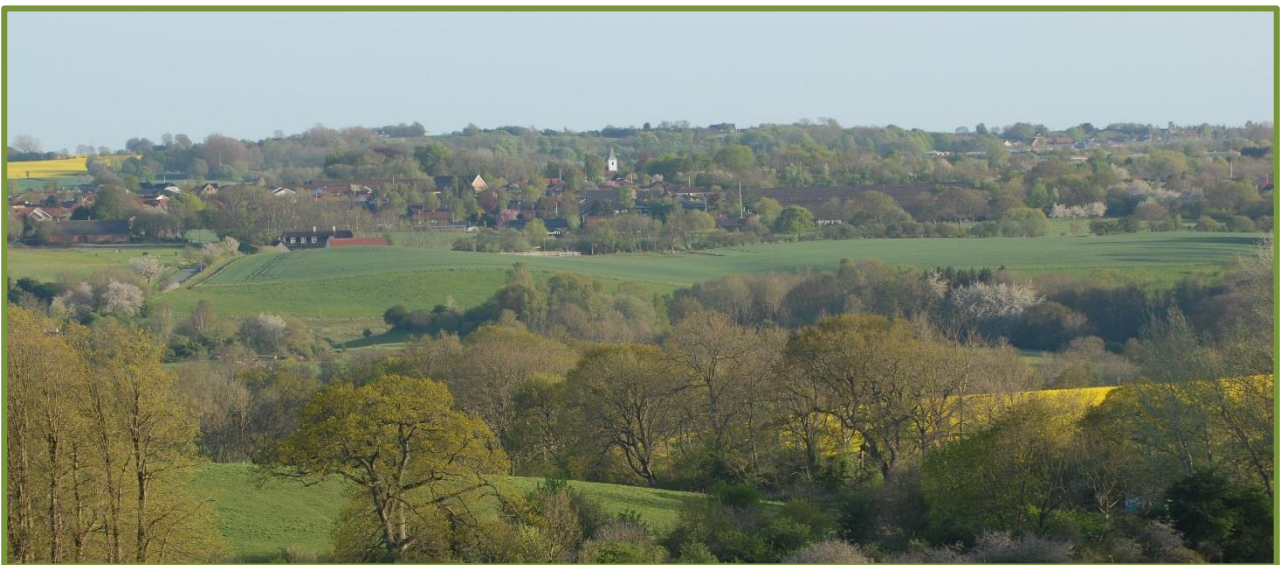
Fulden-fredningen bevarer kulturlandskabet sydvest for Moesgaard

For en uddybning af DN Aarhus' synspunkter, se følgende artikel .