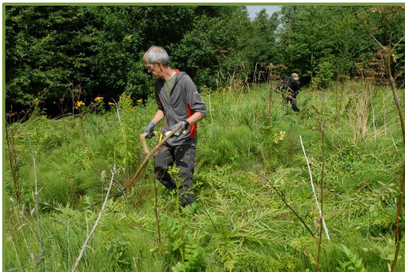
Bekæmpelse af Have-gyldenris foregår med le og knofedt

I 2017 lykkedes det endelig DN Aarhus at påbegynde et længe påtænkt samarbejde med Aarhus Kommune om bekæmpelse af invasive plantearter.