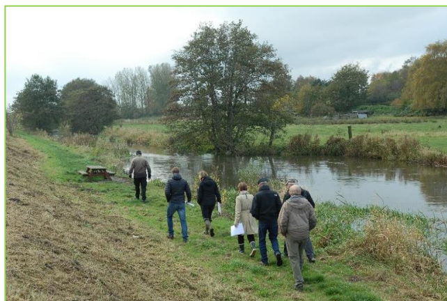
Med Fredningsnævnet på besigtigelse ved Aarhus Å

Vi mener, at det relativt store antal sager indikerer, at klassiske fredninger i høj grad fortsat har en berettigelse som beskyttelsesforanstaltning, idet der til stadighed opstår ønsker om en ændret/øget arealanvendelse indenfor fredninger, som potentielt kan true beskyttelsesinteresserne. Her kan man ikke bare lade det frie initiativ råde, men behøver en procedure, som sikrer en saglig og flerpartisk vurdering, fra sag til sag.