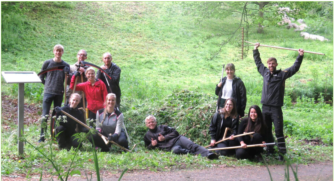
Velfortjent pause efter høslæt i Vennelystparken

Til sidst skal vores årlige høslæt nævnes (som foregår i Vennelyst parken og ved Brand sø). Det skal have den sidste bemærkning fordi fællesskab er enormt vigtigt i foreninger og i DN Aarhus ung er vi blevet rigtig gode til at skabe et godt sammenhold - og det interne høslæt i Vennelystparken er et fremragende eksempel på dette. Vi har et stærkt fremmøde af engagerede DN'ere, både erfarne og uerfarne, som knokler for at slå det høje græs. Efter et vellykket høslæt bestiller vi pizza og drikker en øl eller sodavand og hygger os og lærer hinanden bedre at kende. Det er efterhånden blevet en rigtig god tradition.