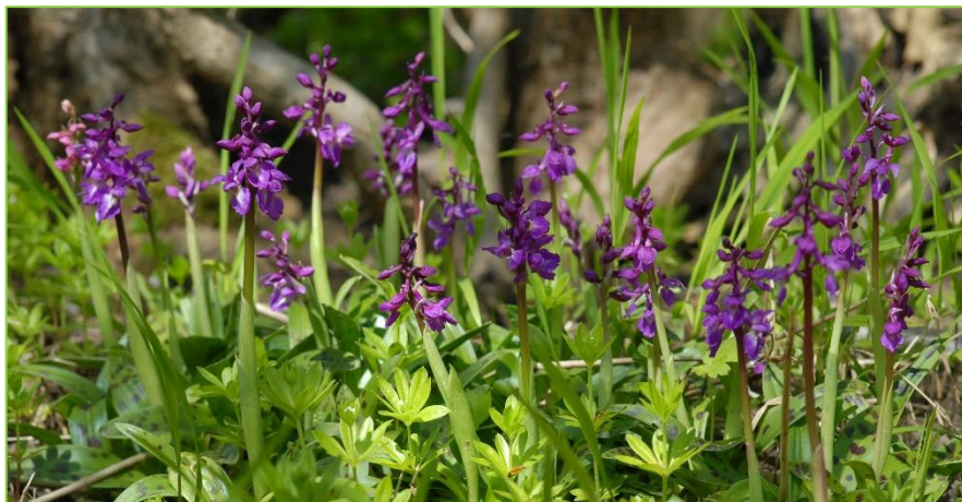
Tyndakset gøgeurt ved Vilhelmsborg