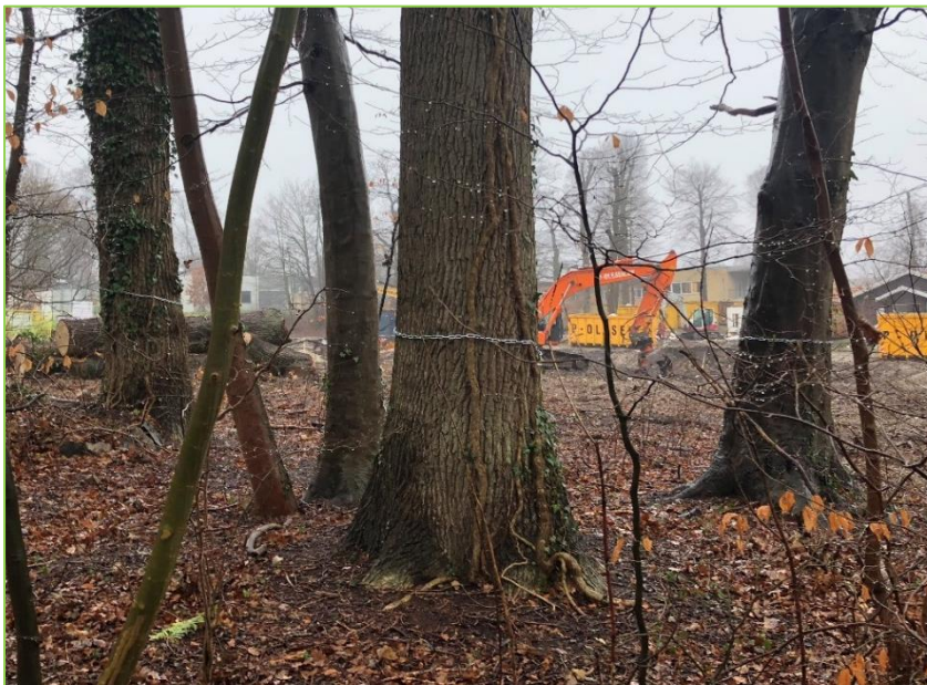
Bevaringsværdige egetræer markeret med kæder

Blandt DN's traditionelle kerneopgaver hører afgivelse af hørings svar og indsigelser overfor myndighedernes afgørelser i sager, der vedrører plan-, natur- og miljøbeskyttelseslovgivning. Det er sjældent muligt at reagere på alt, så vi tvinges typisk til en prioritering af de sager, der enten har størst principiel betydning, som bedst matcher vore lokale kompetencer eller, hvor det vurderes, at chancerne for et positivt udfald står bedst mål med anstrengelserne.