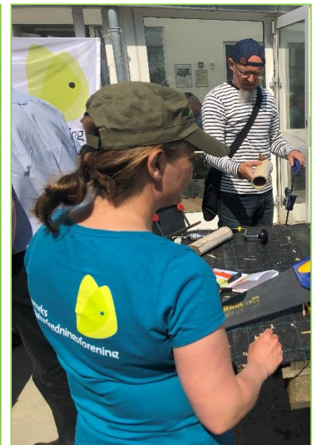
Naturformidling for børn og voksne