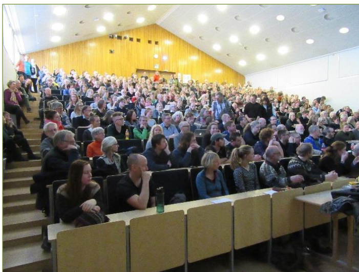
Temadag på AU, 2018

En regulær tradition og årligt tilbagevendende begivenhed er forårets Temadag, hvor DN Aarhus i samarbejde med en række andre grønne organisationer samt Naturhistorisk Museum sætter fokus på en aktuel problemstilling i den danske natur. Det blev i år til en særdeles velbesøgt temadag med den overordnede titel: "Behøver biodiversiteten kunstigt åndedræt?" Ni oplagte og inspirerende oplægsholdere gav de ca. 300 deltagere en berigende lørdag eftermiddag, og for de interesserede sluttede dagen med en buffet.