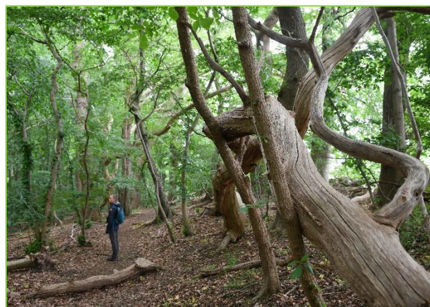
Flisproduktion i Marselisborg Skov vs. urørt skov i Suserup Skov