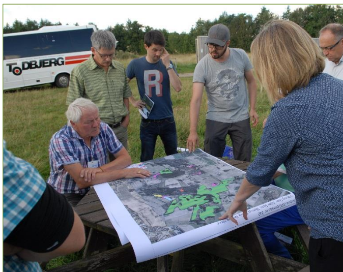
Det Grønne Råd besigtiger Harlev-fredningen

Gennem rigtig mange år har DN Aarhus nydt det privilegium at blive inviteret til et årligt møde med Teknik og Miljø, hvor vi får anledning til at spørge ind til kommunens politik og praktiske forvaltning, og modtager uddybende svar og forklaringer fra højtplacerede embedsfolk. Vi betragter det som et udtryk for, at man anerkender DN som en seriøst og konstruktiv sparringspartner, som det er værd at lytte til og at gå i dialog med. Og denne dialogbaserede relation til myndighederne forhindrer på ingen måde, at DN fortsat kan agere naturens vagthund, om nødvendigt. På seneste møde drøftede vi bl.a. (manglende) offentlig naturvejledning, udvidelse af Aarhus Havn, naturpleje, kirkestien ved Lisbjerg og fremtiden for Moesgaard allé.