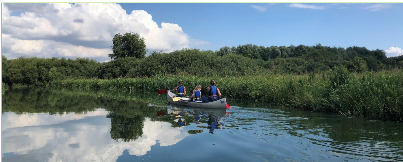
Langs Eskelunden i kano - væk fra byen, midt i byen

Efter mange års politisk tovtrækning om placeringen af en fremtidig, ny eventplads i Aarhus, er valget langt om længe definitivt faldet på Eskelund. Efter en længere proces med forundersøgelser og inddragelse af interessenter, kom det endelige lokalplansforslag i høring dette efterår og DN afgav naturligvis et høringssvar . Heri opfordrer vi til at man respekterer de eksisterende naturværdier og det "vilde" udtryk, og ikke konverterer området til en pyntelig park. Og endelig glæder vi os – tilsyneladende i modsætning til mange andre – over, at det hele ikke plastres til med parkeringspladser, men at cykler og kollektiv trafik indgår som en central præmis for publikumsadgang ifm. de fremtidige musikbegivenheder.