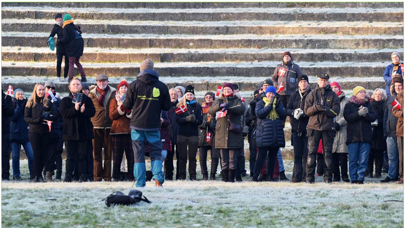
130 fremmødte protesterede mod DF's anslag mod DN's fredningsret

Et historisk udgangs- og omdrejningspunkt for DN's virke, er og bliver fredninger. At rejse en fredningssag er et af foreningens allervigtigste, lovfæstede privilegier, som vi værner om med både respekt, omhu og ydmyghed. Der er imidlertid liberale kræfter i det politiske landskab, som af rent ideologiske årsager anfægter rimeligheden i, at en privat forening kan have så direkte indflydelse på den danske arealanvendelse. Uanset, at det må være åbenlyst for de fleste, at det alene tjener naturens og samfundets bedste. I vinteren 2018 kom dette til udtryk ved en ualmindelig indædt borgerlig kampagne, som Det Konservative Folkeparti heldigvis holdt sig for gode til at støtte, og som derfor ikke fandt politisk flertal.