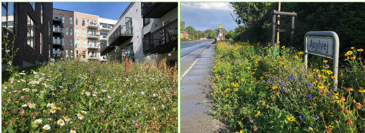
Her og dér indtænkes naturen trods alt i byrummet, når der bygges nyt; Risskov Brynet og Asylvej

Men i øvrigt gjorde vi klart, at skåltaler ikke gør det alene - der skal handling og politisk vilje til at skabe de konkrete forandringer, som især den grønne omstilling fordrer. Og det skal ske i langt større respekt for den eksisterende natur og under hensyntagen til behovet for flere grønne områder i byen, i takt med at Aarhus vokser.