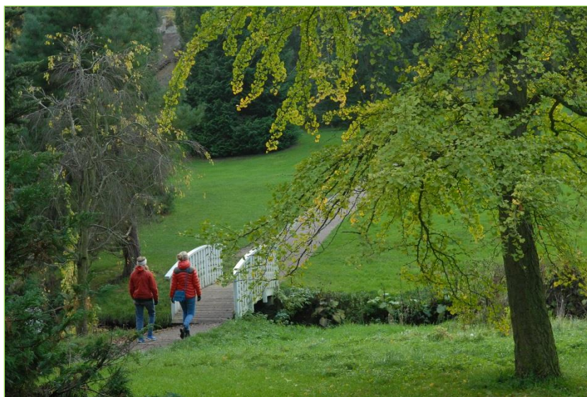
Botanisk Have – fredelig og fredet

Botanisk Have blev fredet ved afgørelse i Miljø- og Fødevarerklagenævnet d. 3. maj 2018. En af de centrale bestemmelser i fredningen er, at Aarhus Kommune senest to år efter fredningens gennemførelse skal udarbejde en plejeplan, som skal udmønte fredningens formål. DN afventer fortsat kommunens udspil, og har naturligvis tilkendegivet en vilje til at bidrage med input.