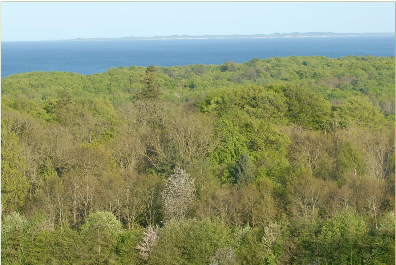
Marselisborg Skov - udlagt til natur og friluftsliv, og urørt af skovningsmaskiner i fremtiden?