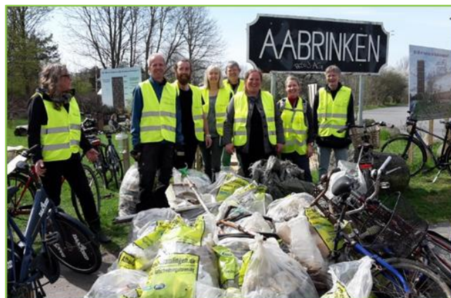
Ministeren skyder Affaldsindsamlingen i gang i Botanisk Have / Dagens høst ved Aabrinken

Derudover var den folkelige opbakning som sædvanligt stor. Der var organiseret indsamlinger over store dele af kommunen fra Tranbjerg, Harlev, Stavtrup over Brabrand, Aarhus C, V og Ø til Risskov, Skødstrup, Spørring, Lisbjerg og Skæring. Det blev til i alt ca. 2 tons affald, og fokus var i år på cigaretskod, hvoraf der blev opsamlet mere end 15.000 stk! Desuden var der stjålet sølvtøj, bortkastede "hundeposer", pap, plast af forskellig karakter, byggematerialer, jernstænger, flasker og mange hundrede dåser (med og uden pant) etc. Efterfølgende blev det indsamlede affald efter aftale med Aarhus Kommune (Ren By Aarhus), hentet og bragt til finsortering og forbrænding/genanvendelse.