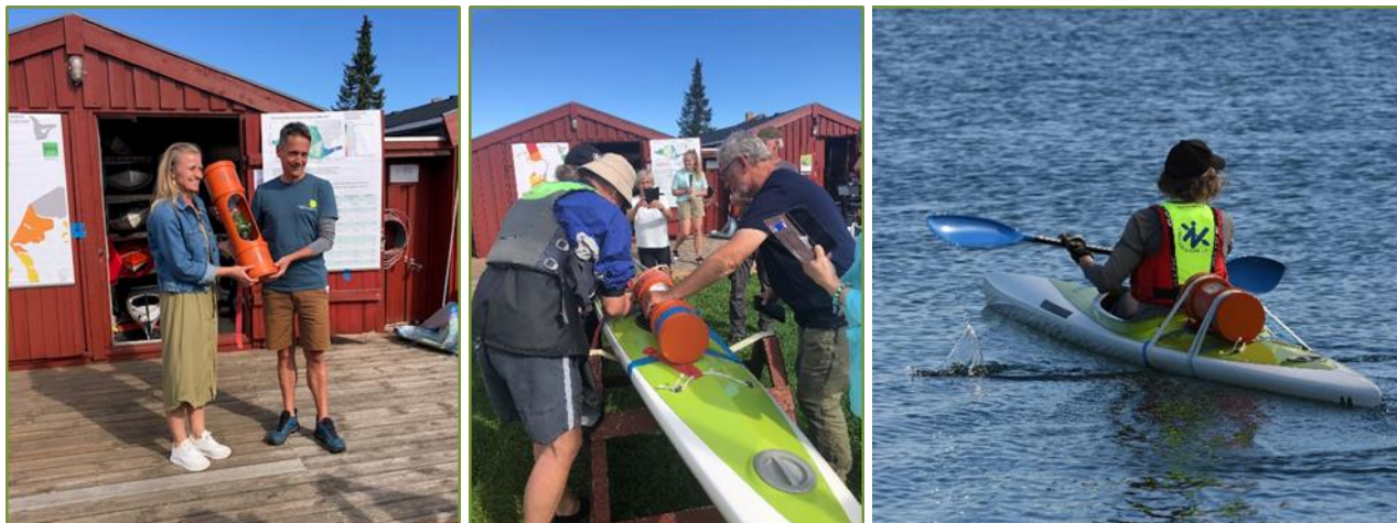
30 dage – 30 fjorde; en DN-kampagne for havmiljøet. Stafetten sendes afsted fra Norsminde.

frivillige ildsjæle, for en måned senere at blive overrakt til Minister for Den Grønne Trepert, Jeppe Bruus, på Christiansborg. I Norsminde var borgmester i Odder Kommune og DN's vicepræsident blandt talerne, inden stafetten sejlede videre med kajak mod Horsens Fjord. Frivillige fra DN Aarhus, DN Odder og lokale aktører bidrog til et vellykket arrangement og en festlig formiddag.