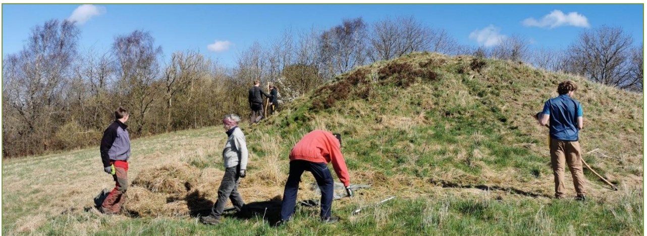
Naturpleje på Kухhøj og ved Døde å, samt Priklæbet gøgeurt i Årslev.