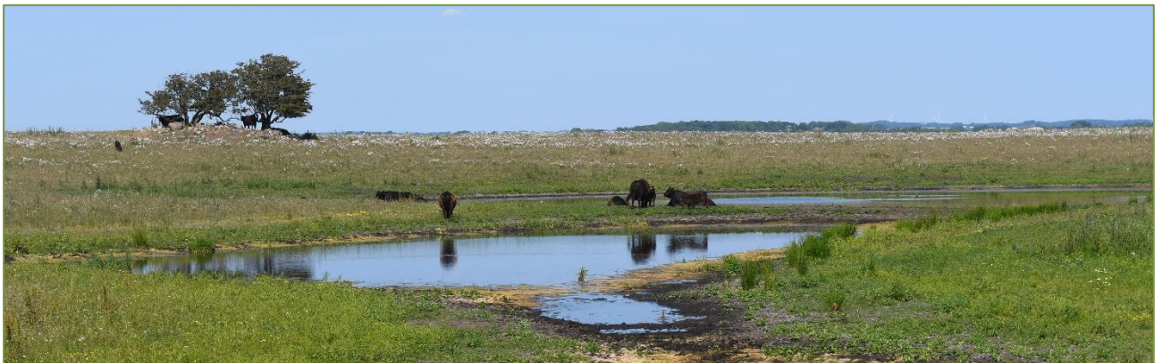
Genskabt, lysåben natur på tidligere landbrugsjord på Knudshoved Odde. Med græssende dyr, selvfølgelig.

Det bedste der længe er sket på biodiversitetsfronten i Aarhus Kommune, må være den politiske beslutning om at udtage ca. 300 ha af kommunens bortforpagtede arealer af landbrugsdrift og lade dem overgå til permanent, vild natur. Dermed har Byrådet banet vejen for projektet med den mundrette arbejdstitel 300 ha ny natur , som Teknik og Miljø i det forgangne år har bragt et stykke af vejen fra vision til virkelighed.