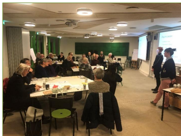
Foreningsliv i DN Aarhus og FLOR.