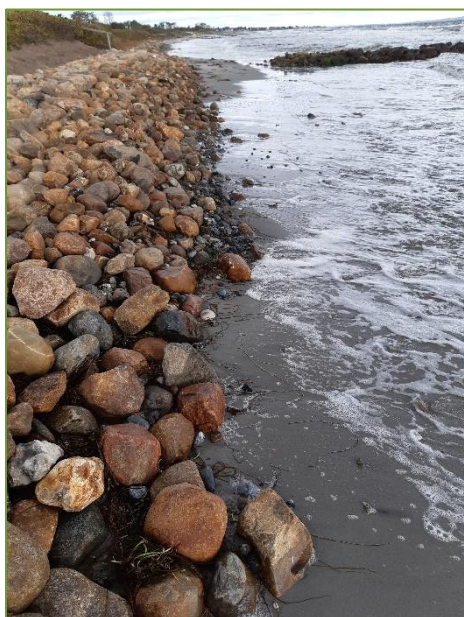
Eksisterende kystbeskyttelse ved Risskov. Passage er vanskelig ved højvande.

Digelaget ved Vejlby Fed i Risskov ansøgte i foråret kommunen om tilladelse til en forstærkning af diget på strækningen mellem Elmevej og Lindevangsvej. Siden strækningen er omfattet af en arealfredning, bad kommunen Fredningsnævnet om en vurdering. Trods sympati med lodsejernes udsatte position i vandkanten, har DN en begrundet bekymring for, at yderligere kystsikring vil vanskeliggøre eller ligefrem forhindre den offentlige adgang langs stranden, som vi i generationer har kæmpet for at opretholde, og som værdsættes af mange. Denne bekymring gav vi naturligvis udtryk for, og pegede i stedet på muligheden for en mere naturnær og langtidsholdbar løsning i form af et barriererev ud for og parallelt med kysten.