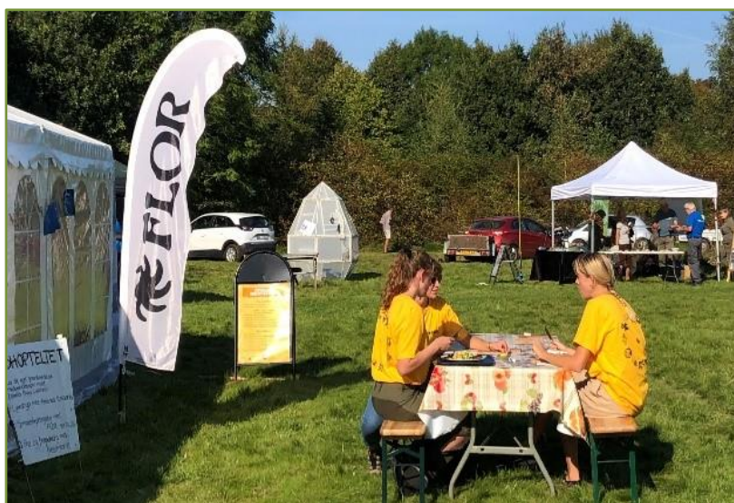
FLOR på farten.

Siden sidste årsberetning har vi skiftet navn fra DN Aarhus Ung til FLOR Aarhus, samt anskaffet os en helt ny visuel identitet og et mere konkret formål om at formidle om og skabe mere vild natur og biodiversitet.