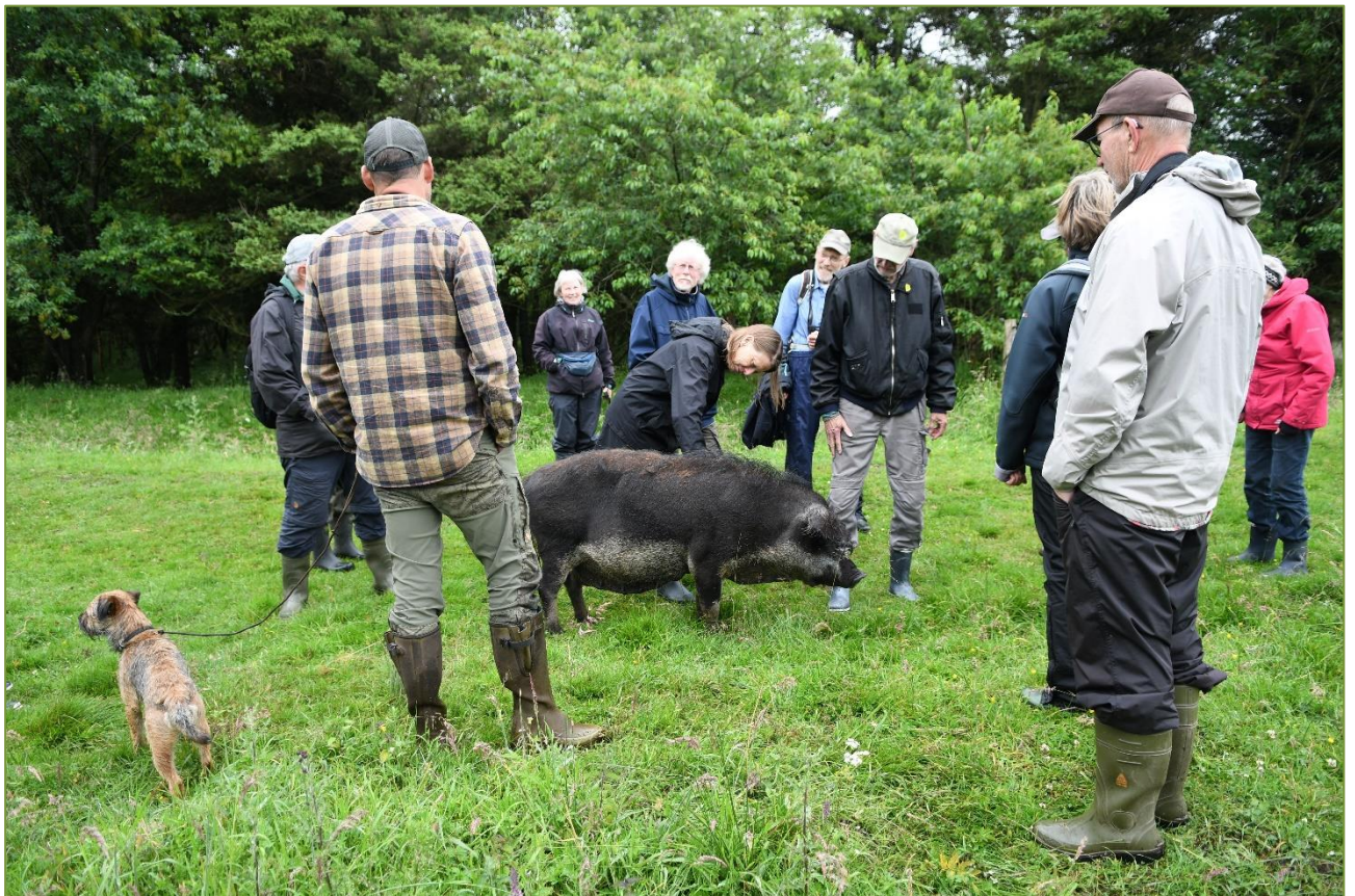
På foreningsudflugt til naturprojektet i Kragelund Mose.

DN Aarhus er en lokal underafdeling af Danmarks Naturfredningsforening. Lokalafdelingen består alene af frivillige medlemmer, organiseret i en bestyrelse og et netværk af menige frivillige. Alle er ulønnede og enhver bidrager efter tid, lyst og evne. Arbejdet foregår typisk i mindre arbejdsgrupper, og fælles drøftelser og beslutninger sker på jævnlige afdelings- og bestyrelsesmøder, hvorunder der også kan være faglige oplæg e. lign. Afdelingens prioriteringer – for sådanne er der nødvendigvis – og daglige arbejde tager udgangspunkt i foreningens nationale dagsorden og officielle politikker, og afspejler gerne en blanding af de frivilliges faglige baggrund og personlige motivation. Men DN Aarhus kan til enhver tid trække på de professionelle ressourcer og fagspecifikke kompetencer, som findes i DN Sekretariatet i København. Og det er faktisk bemærkelsesværdigt, hvor langt man kan nå ad frivillighedens vej. Det er DN Aarhus' virke et forbilledligt eksempel på.