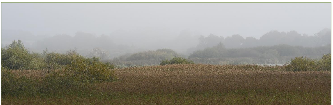
Morgentåge over Tåstrup Mose.

Således gennemføres flere offentlige ture i samarbejde med Dansk Ornitologisk Forening eller Dansk Botanisk Forening, og ikke mindst i sager vedr. havmiljøet er vi i tæt dialog med Danmarks Sportsfiskerforbund. Også på klimafronten foregår der dialog og fælles koordinering med andre aktører som f.eks. Det Fælles Bedste, Bedsteforældrenes Klimaaktion og Den Grønne Ungdomsbevægelse. Og ligeledes i spørgsmålet om skovforvaltning og en vildere natur, er der tæt kontakt til kommunens øvrige grønne græsrodder.