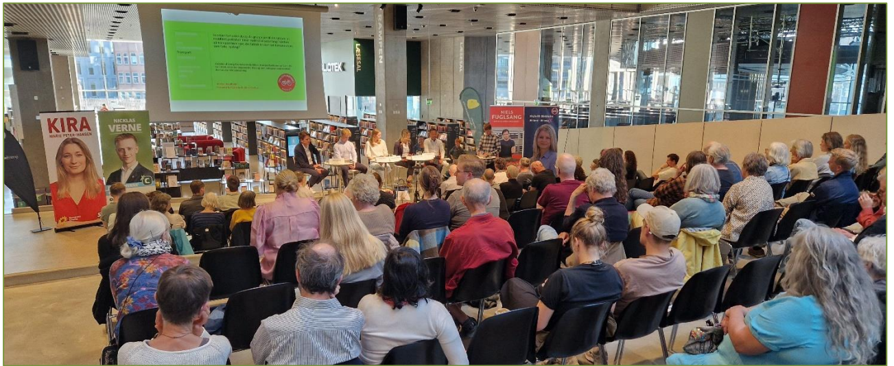
Fælles NGO-debatarrangement på Dokk1 ifm. EP-valget.

velbesøgt og stramt styret, så kandidaterne blev holdt op på både egen politik og det præg de forventede(s) at sætte i deres respektive politiske grupper i parlamentet. Arrangementet foregik i et samarbejde med organisationen Vedvarende Energi, Cyklistforbundet, Mellempfolkeligt Samvirke og Den Grønne Ungdomsbevægelse