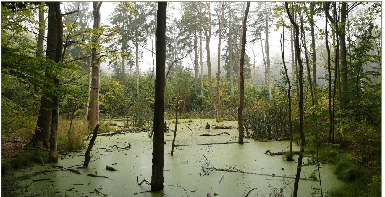
Skræddermosen - vildere og vådere skovnatur i Fløjstrup.

Foruden disse og andre mere spontane relationer og midlertidige projekter, deltager vi i en række permanente fora eller tilbagevendende begivenheder, der på hver deres måde fremmer såvel DN's mulighed for indflydelse, som naturens, klimaets og miljøets bedste i almindelighed. Blandt disse er det værd at nævne følgende: