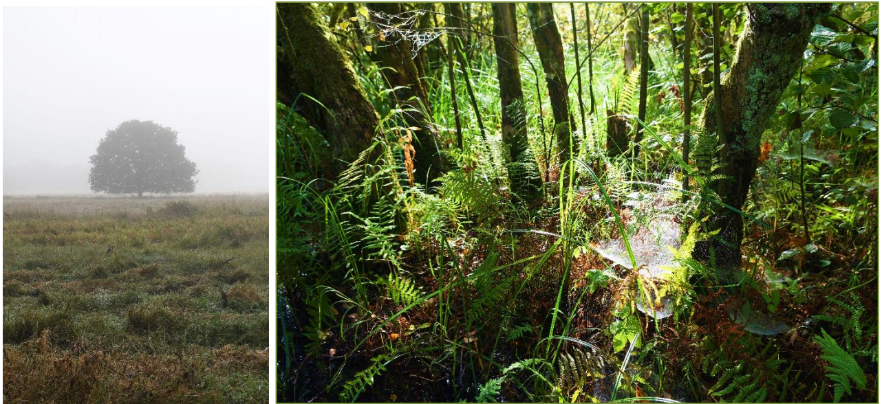
Sommerstemning i Tåstruplandet.

DN Aarhus beskæftiger sig med et væld af forskellige opgaver i årets løb. Med udgangspunkt i foreningens formåls erklæring (§2 stk. 1) om at skabe et bæredygtigt samfund med et smukt og varieret landskab, en rig og mangfoldig natur, et rent og sundt miljø og uden negative klimapåvirkninger er det næsten kun fantasien – og selvfølgelig vore begrænsede ressourcer – der sætter grænserne. I det følgende finder du et repræsentativt udpluk af vore aktiviteter i det forgangne år.