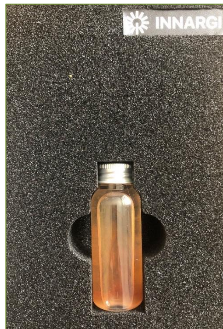
Geotermisk borerig på Aarhus havn og en vandprøve fra 2500 m's dybde.