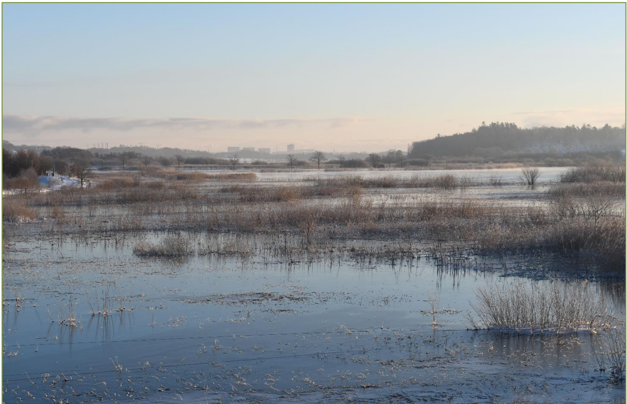
Vinterstemning i Aarhus ådal