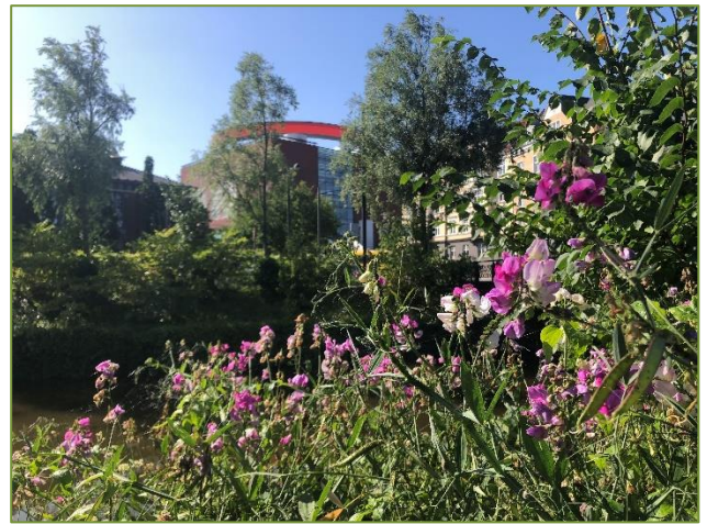
DN-Udstilling om grønne facader i Festugen (tv). Natur i midtbyen.

Senest har bynaturgruppen udarbejdet en fysisk folder med gode råd og praktiske tips til en vildere natur på matriklen. Den uddeles, når de frivillige besøger grundejer- og boligforeninger eller stiller op til formidlingarrangementer rundt omkring i kommunen, og den rummer en QR-kode med relevante og nyttige links, som overflødiggør en hyppig opdatering af selve den trykte folder.