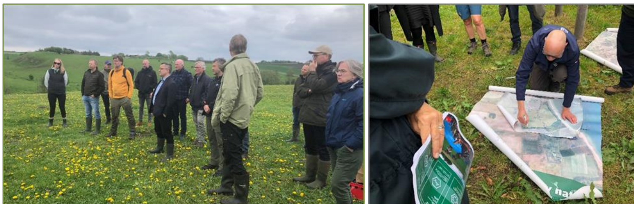
På tur med Teknisk Udvalg i Kasted (tv) og markvandring ved Mariendal.

Det Grønne Råd er kommunalt nedsat, men er en apolitisk sammensætning af organisationer og foreninger, som har særlig interesse i beskyttelsen, benyttelsen og udviklingen af naturen i Aarhus Kommune. Rådet skal medvirke til at sikre en bred og kvalificeret dialog og debat, og derigennem styrke embedsværkets og lokalpolitikernes beslutningsgrundlag. I det forgangne år har Rådet bl.a. været på ekskursion til Kasted Mose med Teknisk Udvalg, og drøftet udfordringer forbundet med debatten om arealanvendelse og fremtidens fysiske planlægning for mere plads til naturen.